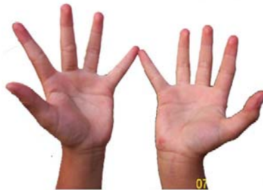
Foto di atas, adalah telapak tangan yang akan digunakan sebagai alat bantu untuk menghitung perkalian, bagian dari telapak tangan yang akan digunakan anatara lain meliputi semua jari, semua ruas jari, dan kuku. Posisi telapak tangan ini disebut sebagai posisi dasar.

Mudah-mudahan adanya cara ini siswa akan menyukai perkalian, karena mereka tidak usah berfikir terlalu sulit. Beberapa siswa SD Bina Talenta, yang telah diberitahu cara perkalian ini, tampak antusias dan tersenyum sambil berkata: Mudah ya, Pa....! seperti tidak mempercayai kemampuannya.